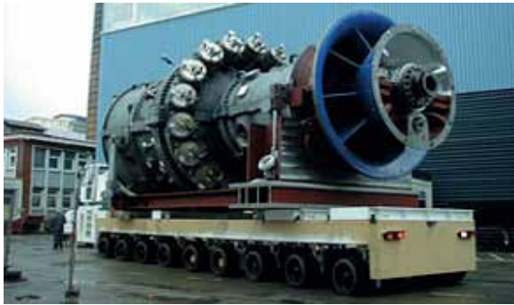
Самоходный прицеп (300 тонн) Отрасль: энергетика. Газовая турбина Точность позиционирования - 1 мм.