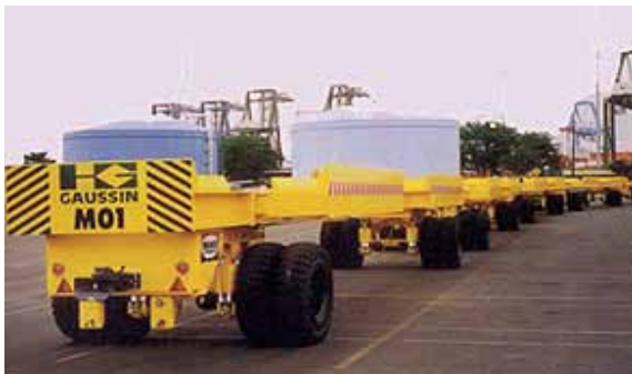
Мультитрейлерная система (5 прицепов)