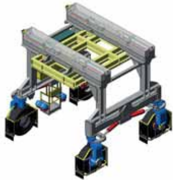
Портальный самоходный кран Отрасль: энергетика. Грузоподъемность до 60 т.