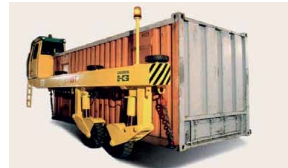
U - образный прицеп