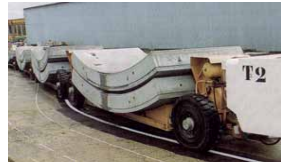
Автопоезд для транспортировки ЖБИ при строительстве туннелей. Длина - 87 м. Точность управления +/- 20 мм.