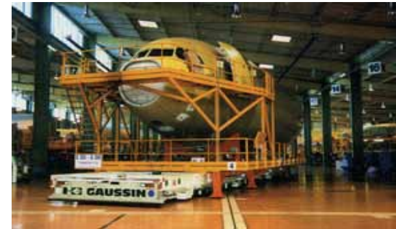
Самоходная многофункциональная тележка Отрасль: Аэрокосмическая промышленность Длина - 23,15 м. Ширина - 4 м. Г/п - 44,5 т.